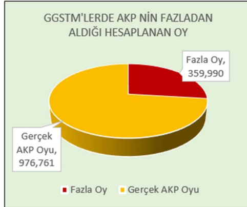
Şekil_3: GGTSM'lerde AKP'nin Fazladan Aldığı Hesaplanan Oyların Oranı

GGTSM'lerde AKP'nin aldığı 1,336,751 oydan 359,990 tanesinin fazladan AKP oyu olduğu hesaplanmaktadır.